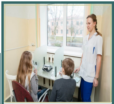
Имеется мини- бассейн.